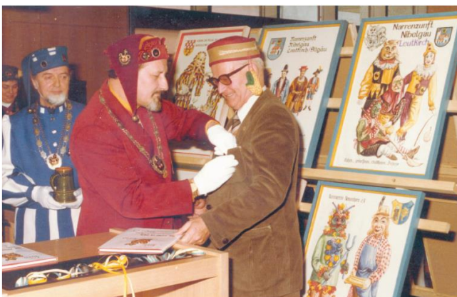
1981: Das erste Narrenbuch wird in Leutkirch präsentiert.

Die Ziele des Verbandes haben sich zwar nicht verändert, aber erweitert. Unter anderem findet heute eine strengere Überwachung der Zünfte statt, um fremdländische Einflüsse und untypische Brauchtumselemente zu vermeiden.